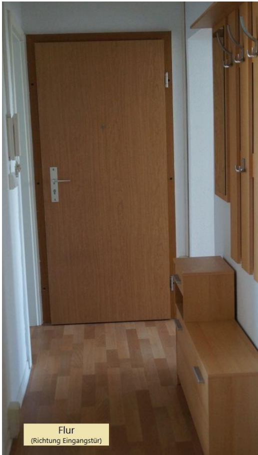
Flur (Richtung Eingangstür)